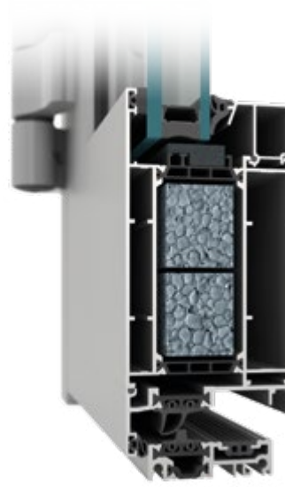
drzwi MB-79N SI+''