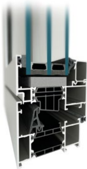
okno MB-79N E