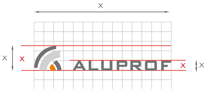
wymiary diagramu konstrukcyjnego 14x3 X